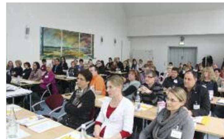
60 Haupt- und Ehrenamtliche aus ASJ und ASB nahmen an der Fachtagung teil.